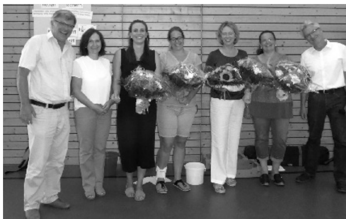
Bürgermeister und Schulleiter verabschieden sich von Lehrkräften und Mitarbeitern.