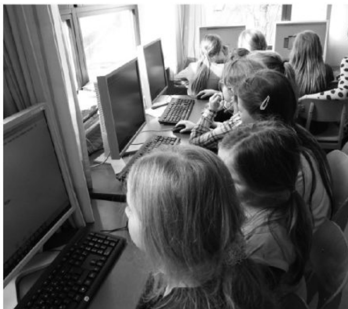
Unsere Lehrkräfte beim Kennenlernen der Lernsoftware und die 3b bei der Arbeit am PC