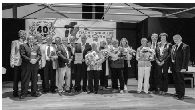
Mitglieder des TTC Waldbrunn, die für langjährige Mitgliedschaften und verdienstvolle Tätigkeiten in der Vorstandtschaft ausgezeichnet wurden.